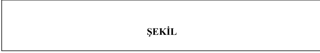
Şekil 1.4: 3-D Sistemi Şeması.

William J. Reddin, Managerial Effectiveness (New York: McGraw & Hill Book Company, 1970), 38.